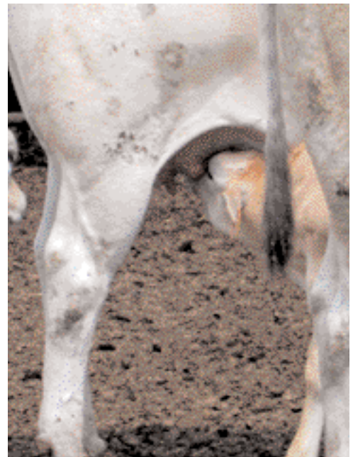
FOTO 1. Vitello piemontese che succhia dalla madre.

Si tratta di una problematica che praticamente interessa tutti gli allevamenti: presto o tardi il problema si presenterà, riguardando uno o più animali. In letteratura sono segnalati casi di allevamenti in cui fino al 30% degli animali presenti, presentava questo problema [3, 4] Spesso gli allevatori lamentano il fatto