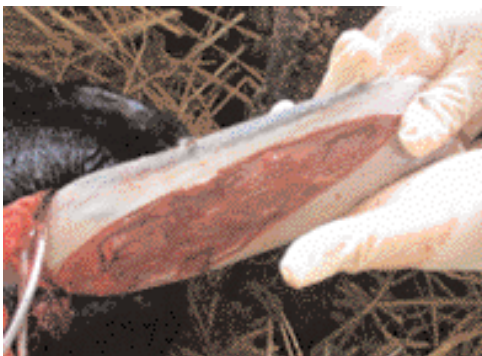
Foto 4-5. La resezione della mucosa dovrebbe includere anche parte del muscolo.