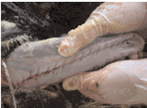
Foto 6. La sutura è un sopraggitto semplice comprendente la parte muscolare e la mucosa.

troppo la funzionalità dei medesimi è scarsa e/o, nella migliore delle ipotesi, essi limitano solo temporaneamente il problema fino a quando il soggetto non avrà "trovato" il sistema di succhiare, pur se con un anello al naso o al frenulo linguale.