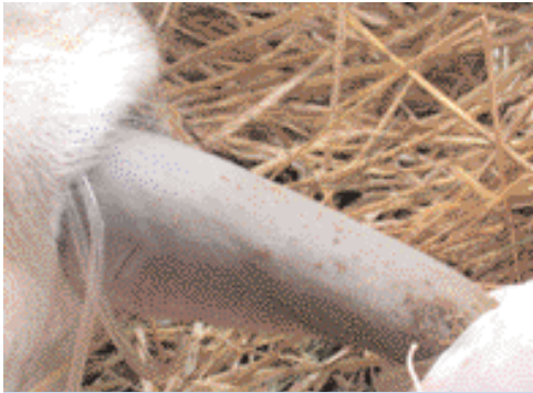
Foto 2. Con l'animale in decubito si estrae la lingua del bovino e la si lega dietro il frenulo con il tubo di un deflussore.