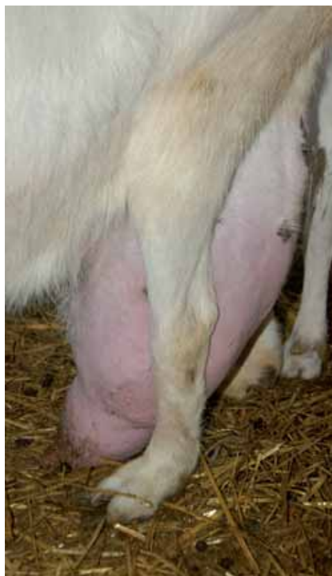
Foto 3. Capra Saanen che a seguito del cedimento dell'apparato sospenditore della mammella, ha i capezzoli a contatto del pavimento. Il rischio di traumatismi e/o di infezioni della mammella aumenta enormemente in condizioni come queste.

È necessario ricorrere all'anestesia generale: la durata dell'intervento, la necessità di mantenere il paziente immobile (per non ostacolare il gravoso compito di legatura dei vasi sanguigni), il rischio di avere dei rigurgiti (polmonite ab ingestis ), impongono un protocollo anestetico collaudato e garantito. La disponibilità di un'anestesia gassosa è sicuramente ottimale, ma si tratta di una opzione raramente disponibile per il veterinario buiatra che lavora in campo. Esistono