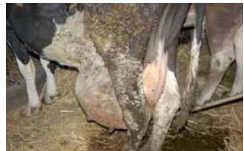
FOTO 2. Bovina da latte con cedimento dell'apparato sospensore.