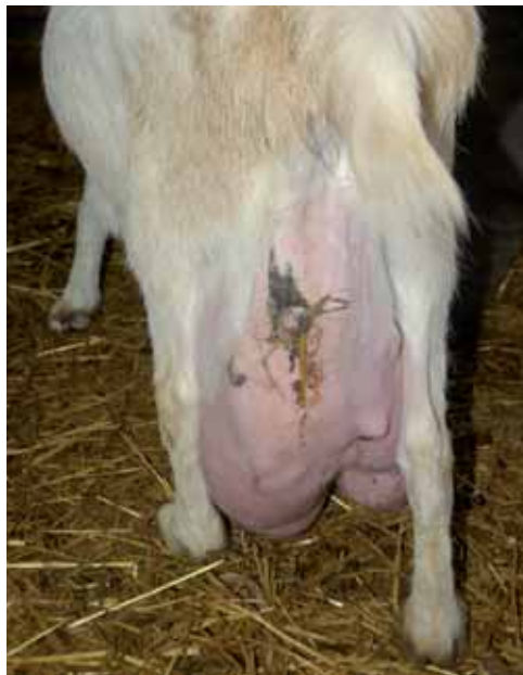
FOTO 1. Capra Saanen con rottura dell'apparato sospensore della mammella. Nel caso in cui il certificato genealogico dell'animale sia di grande valore può essere consigliato il ricorso alla mastectomia.

Questa tecnica viene applicata in caso di bovini, caprini ed ovini, di elevatissimo valore genetico, affetti da gravi patologie mammarie. Si può trattare di una mastectomia totale oppure di una emimastectomia. Tra le cause possibili, per le quali è necessario ricorrere a questo intervento, si devono ricordare: neoplasie mammarie, mastite gangrenosa, mastiti granulomatose, oppure rotture dell'apparato sospensore della mammella [1]. Quest'ultima occasione è forse la più comune (foto 1 e 2): la mammella si abbassa note-